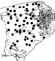
Hochmittelalterliche Besiedlung (11. H. 14. Jh.)

Während des hochmittelalterlichen Landesausbaus (14. Jh.) wurde die Stubnitz nicht besiedelt.